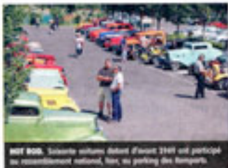
HOT ROD. Soixante autos dotées d'avant 1940 ont participé au rassemblement national, hier, au parking des Remparts.

trois ans », indique son propriétaire. Et celui-ci a passé la minute jusqu'à faire en sorte d'avoir une plaque mémorielle portant le numéro... 402. « J'ai offert une boîte de chocolats à la secrétaire de la Préfecture de Caen pour qu'elle garde mon dossier sous le coude jusqu'à ce que ce numéro arrive, s'achète. On pourrait bien m'en proposer n'importe quelle somme, je ne la vendrai jamais ! ».