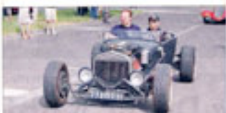
LA PLUS ANCIENNE ■ Une Ford de 1927 à carrosserie latérale, avec jantes en acier et moteur d'origine...